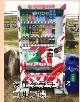
矢尾グラウンドゴルフ場