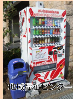
地域福祉センター

この自動販売機は売上金の一部が共同募金への募金になります。そのため、自動販売機で飲料を購入することで募金に協力いただけます。