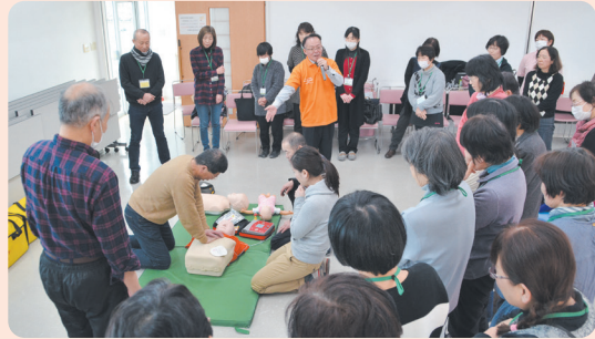
8年度第2回 活動員全体研修会 普通救命講習会 1活動員協議会 (福)早島町社会福祉協議会

座学では、応急手当が救命率を高め、早期のAED使用で社会復帰率が向上するなど、応急手当の必要性やAEDの機能について、説明がありました。