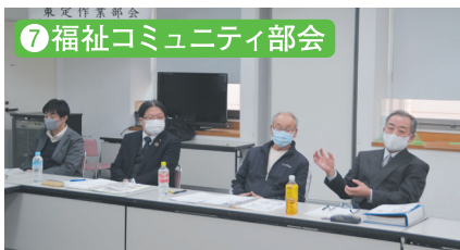
⑦ 福祉コミュニティ部会