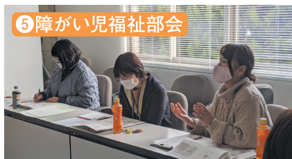
⑤ 障がい児福祉部会