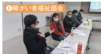
⑥ 障がい者福祉部会