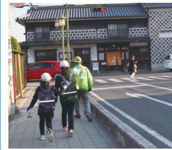
積極的な挨拶を心掛けています